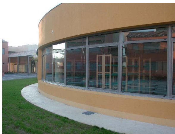
Amphithéâtre et le CDI