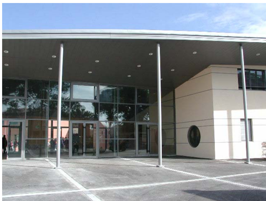
Entrée principale : la façade mur rideau traditionnelle est protégée par une vaste avancée de toit qui fait de l'ombre en été