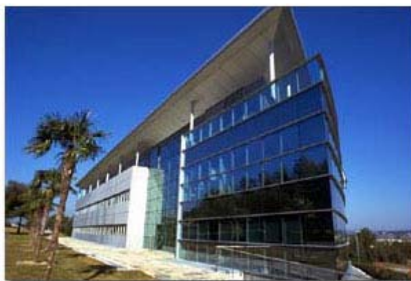
Maître d'oeuvre : R. CARTA - RCT -France